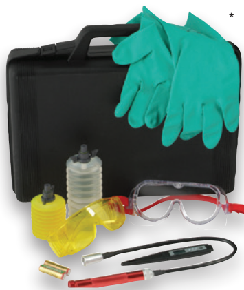
Opcjonalny zestaw akcesoriów*