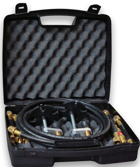
Opcjonalny zestaw do płukania*