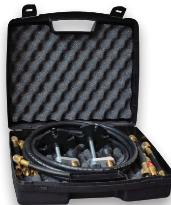
Opcjonalny zestaw do płukania*